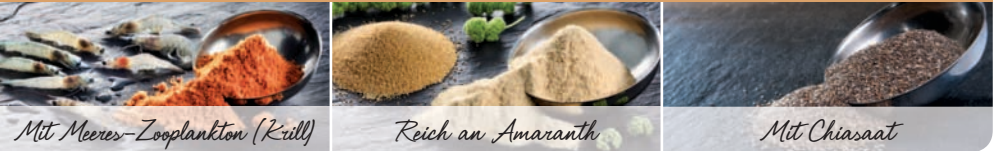
Mit Meeres-Zooplankton (Krill)