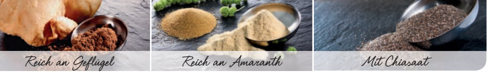
Reich an Geflügel