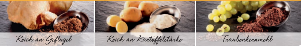
Reich an Geflügel