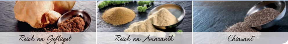
Reich an Geflügel