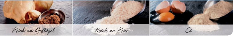
Reich an Geflügel